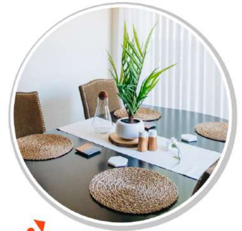
새로운 테이블 준비