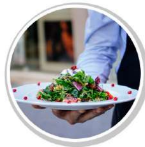
요리 완성 & 서빙