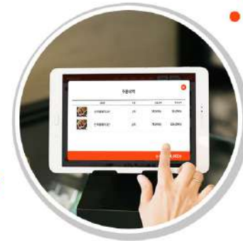
식사 후 태블릿을 통해 계산서 요청