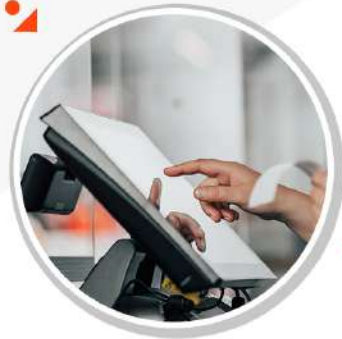
포스 자동 등록 주문서 출력