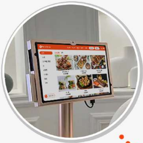
고객의 언어로 메뉴 직접 주문